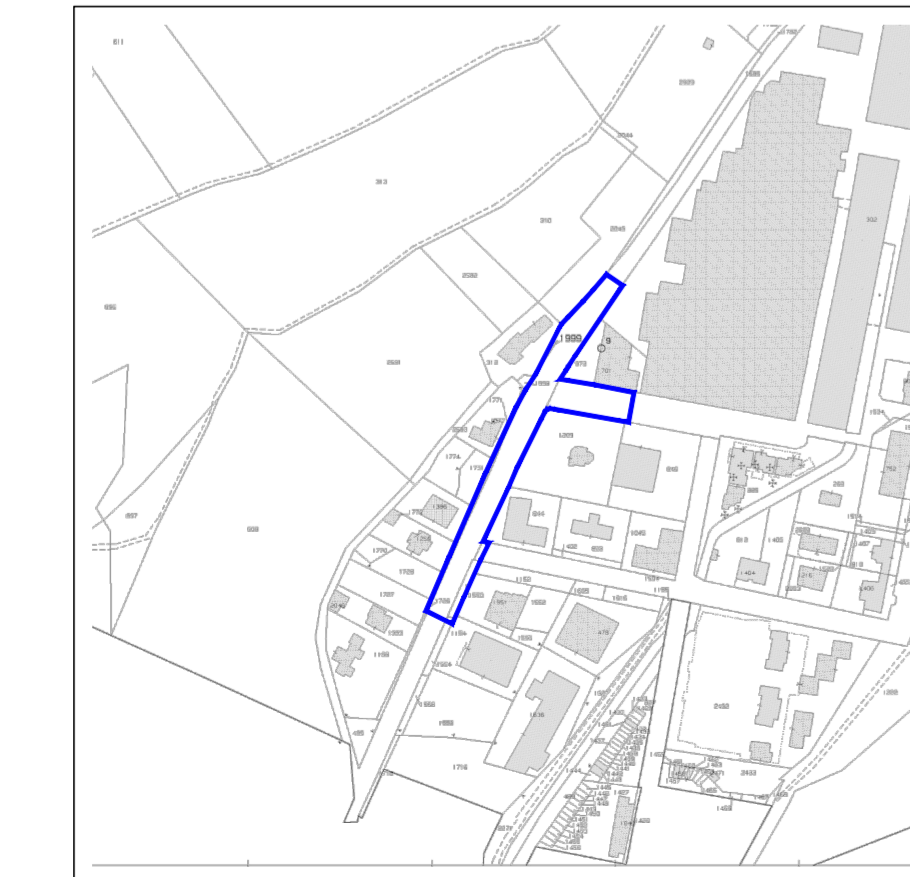
ESTRATTO MAPPA CASTALE

LEGENDA: Riferimento fotografico: si veda documentazione fotografica Area di intervento