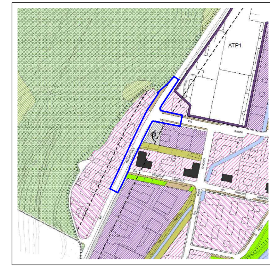
ESTRATTO PIANO DELLE REGOLE Tav. C2: Ambiti da assoggettare a specifica disciplina