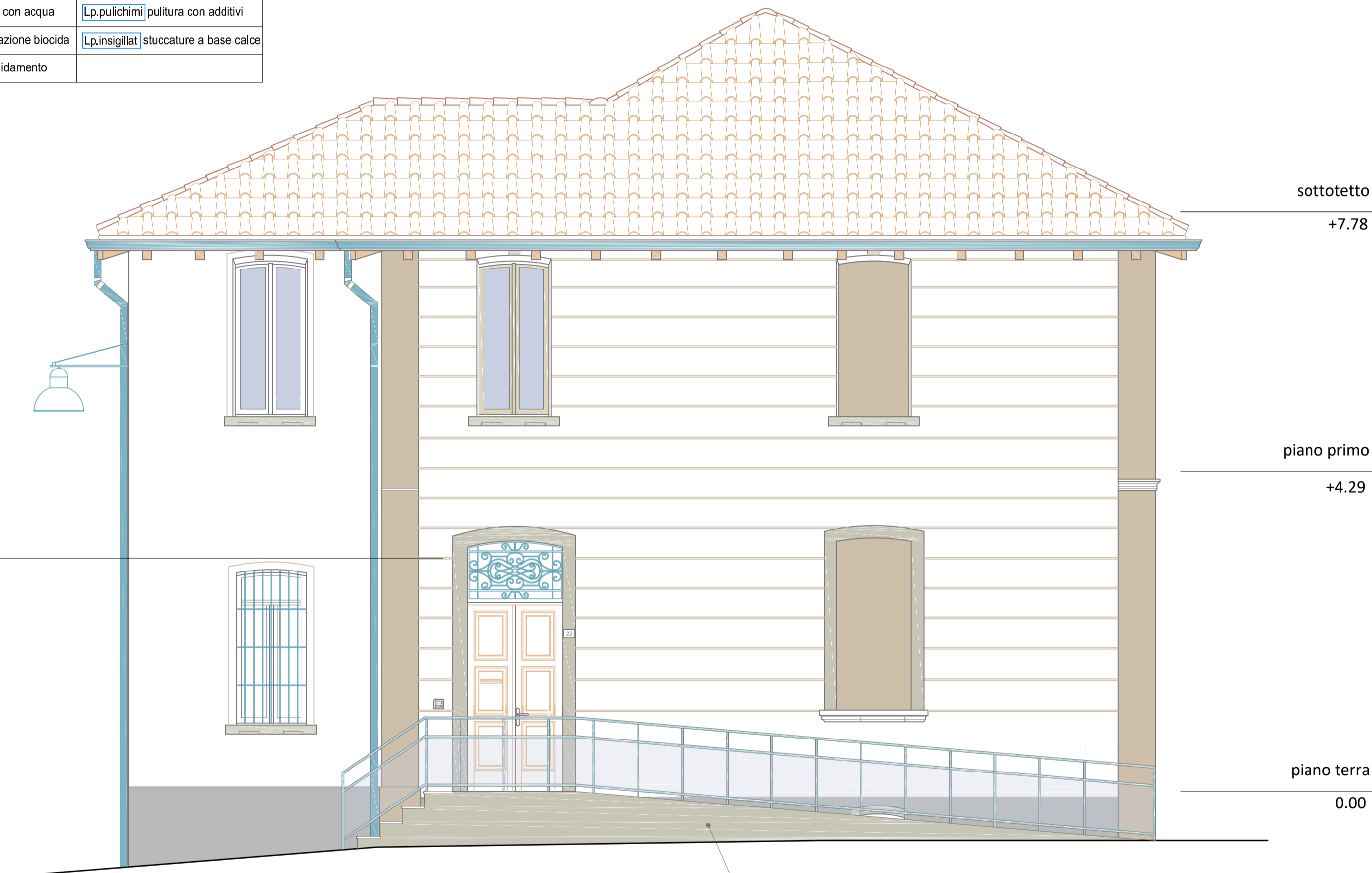
PROGETTO D'INTERVENTO DEL PROSPETTO OVEST

OPERE EDILI SUI PROSPETTI ESTERNI Le operazioni utilizzate in questi interventi sono descritte nel computo metrico estimativo. rimozione di impianti aerei di facciata, bacheche e cartelli rimozione e revisione dei pluviali