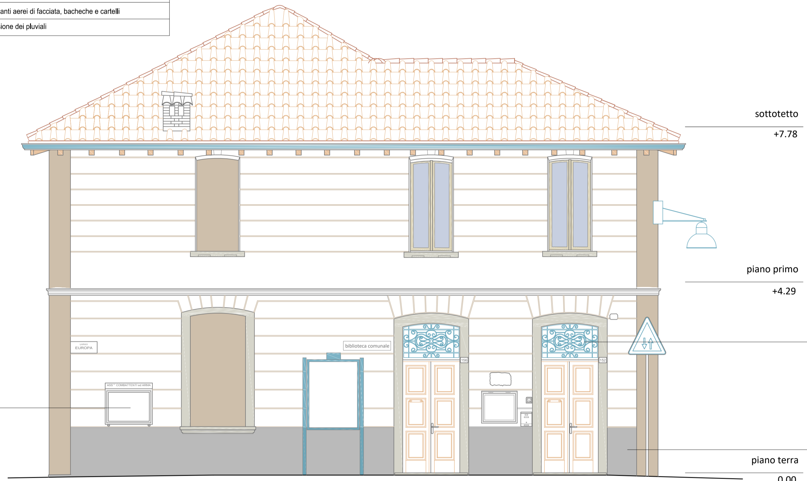
PROGETTO D'INTERVENTO DEL PROSPETTO EST

Realizzazione di una nuova rampa di accesso all'edificio sul fronte Ovest ai fini dell'abbattimento delle barriere architettoniche