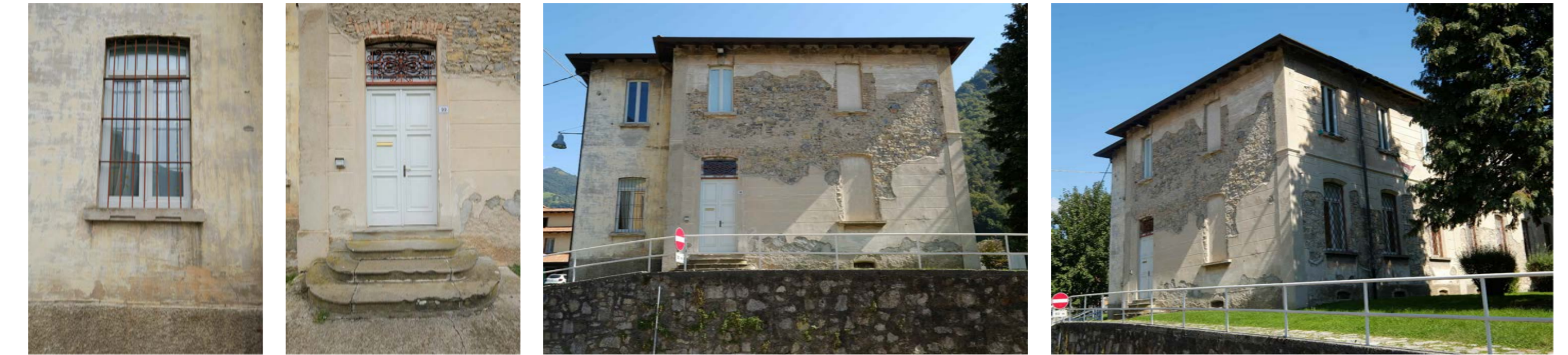
PROSPETTO OVEST - RILIEVO FOTOGRAFICO

QUESTO ELABORATO GRAFICO E' ALLEGATO ALLE SEGUENTI RELAZIONI TECNICHE: - Relazione A - Analisi conoscitiva dello stato di fatto e ricerca storica