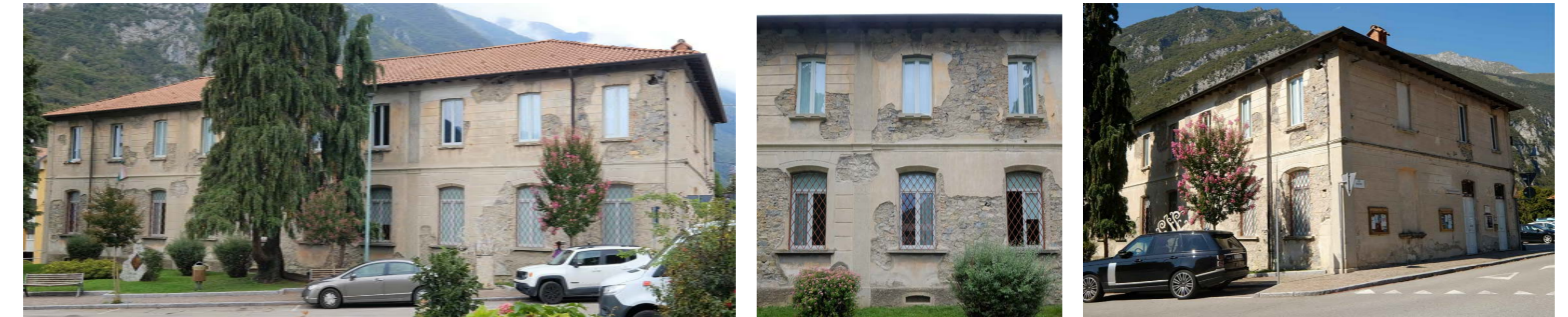
PROSPETTO SUD - RILIEVO FOTOGRAFICO

NOTA: L'analisi del degrado è riferita alle facciate e riguarda sia i materiali lapidei, sia gli intonaci. Le alterazioni qui presentate sono solo una parte di quelle previste dalle Raccomandazioni Normal e rappresentano i casi più frequenti ed evidenti rilevabili sulle facciate.