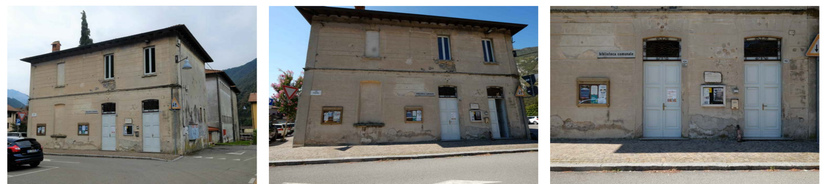
PROSPETTO EST - RILIEVO FOTOGRAFICO