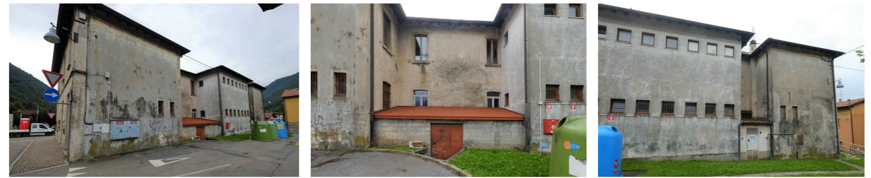
PROSPETTO NORD - RILIEVO FOTOGRAFICO

NOTA: L'analisi del degrado è riferita alle facciate e riguarda sia i materiali lapidei, sia gli intonaci. Le alterazioni qui presentate sono solo una parte di quelle previste dalle Raccomandazioni Normal e rappresentano i casi più frequenti ed evidenti rilevabili sulle facciate.