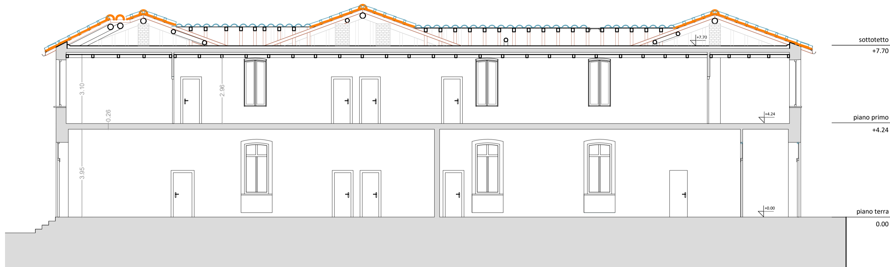
SEZIONE B - SCALA 1:100