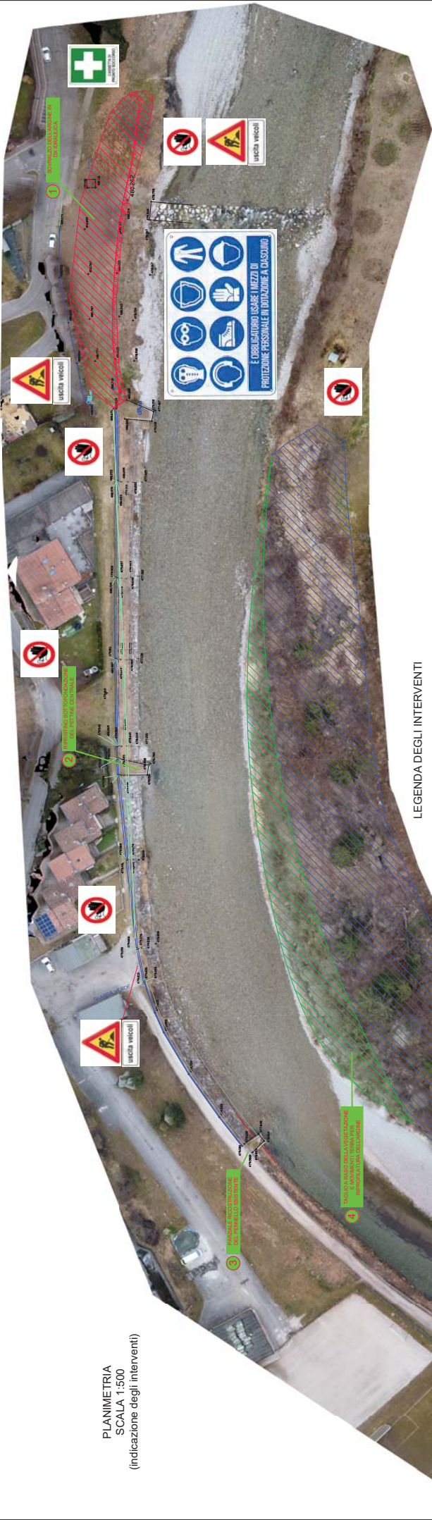
PLANIMETRIA SCALA 1:500 (indicazione degli interventi)